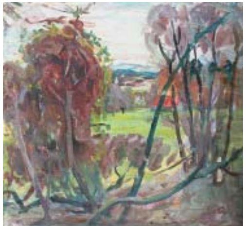
Blick aus dem Atelier des Künstlers